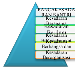
Gambar 3. Nilai

Sudah jelas bahwa memang nilai-nilai di atas menjadi bagian dari kurikulum pesantren Nurul Jadid yang mencakup misi ganda (profit dan sosial) lembaga pendidikan yang mulia ( noble industry ). Rumusan strategi yang ada tentunya juga tidak mudah dalam perwujudannya dan sepertinya tidak mungkin tercapai tanpa dilandasi oleh nilai-nilai spiritual yaitu: iman, ilmu dan ihsan. Untuk lebih jelasnya, di bawah ini diuraikan setiap realisasi dari dua strategi pesantren Nurul Jadid sebagai noble industry .